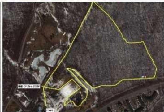
2 km loop / boucle de 2 km