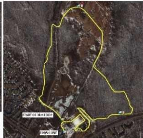
3 km loop / boucle de 3 km