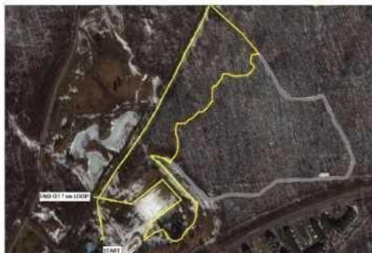
1.5 km loop / boucle de 1.5 km